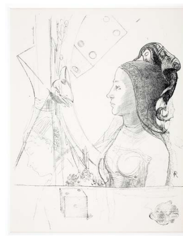
Odilon Redon, La Femme au hennin , 1898. Projet d'illustration pour Un coup de dés jamais n'abolira le hasard de S. Mallarmé. Lithographie, 32,4x25 cm, inv. 987.1.1, musée départemental Stéphane Mallarmé, Vulaines-sur-Seine