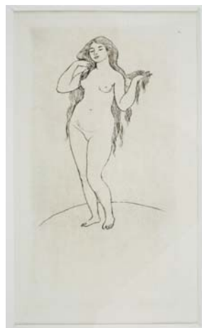
Auguste Renoir (1841-1919), Frontispice pour Pages cd S. Mallarmé, eau-forte originale, tirage sur papier séparé, 52 x 42 cm, inv. 998.10.1, musée départemental Stéphane Mallarmé, Vulaines-sur-Seine