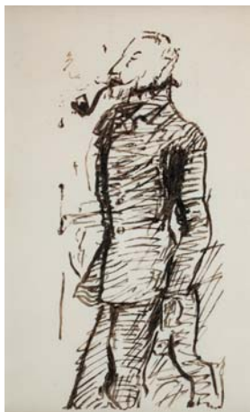
Paul Verlaine, Stéphane Mallarmé au cours d'un des Mardis, croquis, s.d., inv. 993.3.1, Musée départemental Stéphane Mallarmé, Vulaines-sur-Seine