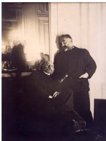
Edgar DEGAS, Mallarmé et Renoir, photographie, 1895, Inv n°985-114-1, Musée départemental Stéphane Mallarmé, Vulaines-sur-Seine