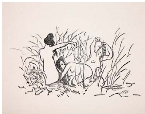
Edouard MANET, Illustration pour l'Après-midi d'un Faune, 1876, Inv : 985.342.1, Musée départemental Stéphane Mallarmé, Vulaines-sur-Seine