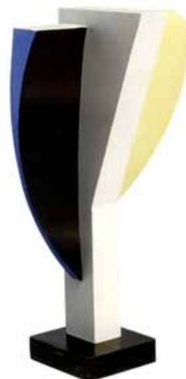
[Coure le froid avec ses silences de faux] , huile et acrylique sur bois [sculpture], 66 x 33 cm, 1951, coll. Fonds d'atelier.