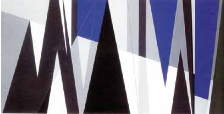
Et surtout ne vas pas frère acheter du pain , technique mixte sur toile, 103 x 202, 1959 - Photo : Gilbert Mangin - ADAGP, Paris 2013.

L'HOMMAGE D'UN ARTISTE DU 20 ÈME SIÈCLE À L'UNIVERS DE STÉPHANE MALLARMÉ