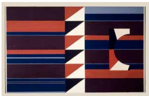
Tout à coup et comme par jeu , gouache sur toile, 54 x 81 cm, 1961, coll. Fonds d'atelier.