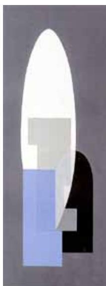
Ni la clarté déserte de la lampe , gouache sur contreplaqué, 72 x 19 cm, 1958, coll. Fonds d'atelier.