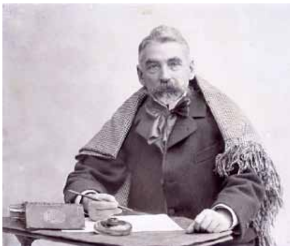
Paul Nadar, Stéphane Mallarmé au châle, 1895, Inv.985.40.1, Coll. MDSM, Vulaines-sur-Seine