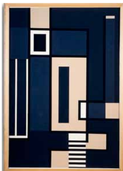
Indomptablement a dû , technique mixte sur isorel apprêté, 92 x 63 cm, 1961, coll. part. Paris.