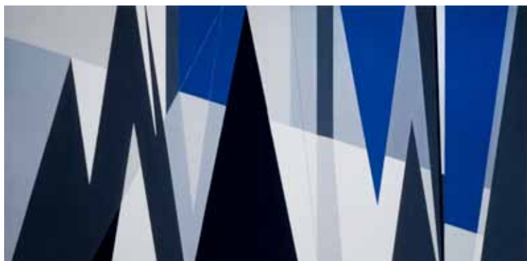
Et surtout ne va pas frère acheter du pain , technique mixte sur toile. 103 x 202 cm, 1959, coll. Fonds d'atelier.