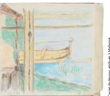
Carnet de dessins attribués à Mallarmé