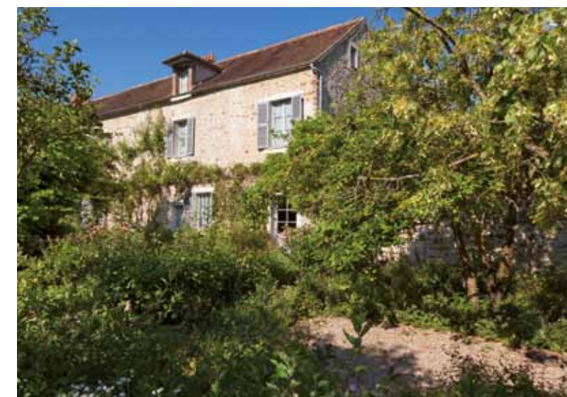
Musée départemental Stéphane Mallarmé

Dans les salles du rez-de-chaussée, les expositions temporaires complètent l'évocation de l'univers de cet écrivain exceptionnel qui joua un rôle de premier plan dans la vie intellectuelle et artistique de son temps.