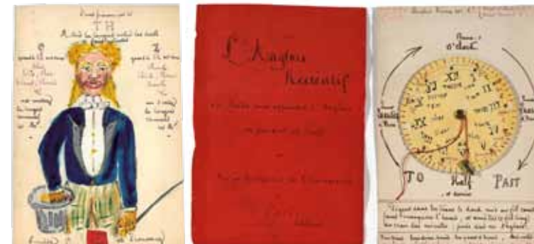
Fiches pédagogiques © Chancellerie des Universités de Paris Bibliothèque littéraire Jacques Doucet

Des jeux et éléments tactiles, en relief et braille, ponctuent le parcours le rendant accessible aux personnes mal et non-voyantes.