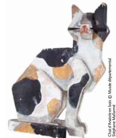
Chat d'Anatole en bois © Musée départemental Stéphane Mallarmé