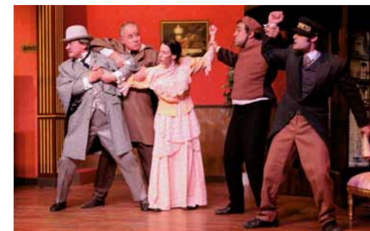
« L'Anglais tel qu'on le parle » de Tristan Bernard / Compagnie TidCat

Sur réservation au 01 64 23 73 27 ou par mail : mallarme@cg77.fr